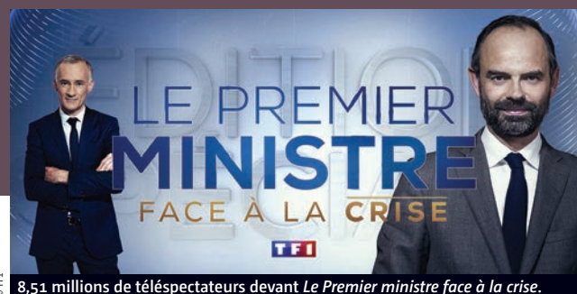
8,51 millions de téléspectateurs devant Le Premier ministre face à la crise .

E n semaine 3 du confinement, ce n'est pas ni une comédie ni un jeu d'aventures aux parfums exotiques qui rafle le record hebdomadaire, mais la soirée d'information avec Édouard Philippe proposée par TF1. Jeudi 2 avril, entre 20h40 et 22h10, Le Premier ministre face à la crise a fédéré 8,51 millions de téléspectateurs (30,1% de PDA) loin devant ses concurrentes. Cependant, Why Women Kill , la nouvelle série de M6, résiste bien avec 4,14 millions de téléspectateurs (14,7%) pour le seul inédit du prime-time, pratique désormais généralisée chez les diffuseurs afin d'économiser ses programmes frais. Jeudi 26 mars, au soir de son lancement, la série américaine en avait réuni 4,5 millions (17,2%) en moyenne sur les deux opus. France 3 attire de son côté 2,2 millions d'amateurs (9%) avec le remake du western de Delmer Daves, 3h10 pour Yuma , un score supérieur à la moyenne 2019 de la case, tandis que Coronavirus: l'état d'urgence , la