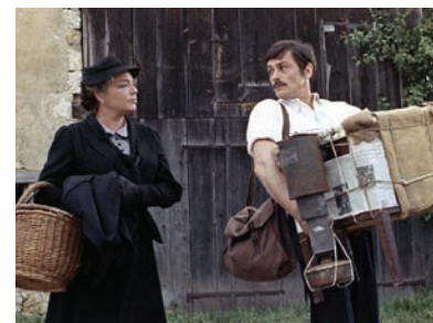
La veuve Couderc.

Médiamat hebdo, journée de 3h à 3h, 4 ans et plus. Source Médiamat-Médiamétrie. Ces résultats intègrent l'audience des services de catch-up des chaînes. *Chaînes historiques, de la TNT gratuite dont le seuil d'initialisation dépasse 95% de la population française** ainsi que Canal+ Cinéma, Canal+ Sport, Canal+ Décalé, Canal+ Family et Canal+ Séries.