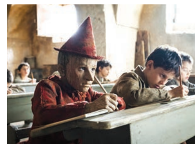
🕒 Pinocchio de Matteo Garrone.

Les utilisateurs abonnés à Prime pourront voir Pinocchio via l'application Prime Video disponible sur Smart TV, appareils mobiles iOS et Android, tablettes Fire TV, Fire TV stick, Apple TV, en ligne sur Primevideo.com et sur les boxes internet Bouygues