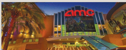
Le circuit AMC compte 634 cinémas outre-Atlantique.

Le plus important circuit nord-américain a menacé le studio de ne plus projeter ses films s'il envisageait, à l'avenir, des sorties simultanées en salle et en ligne. Un avertissement valable pour les autres studios. ■ VINCENT LE LEURCH