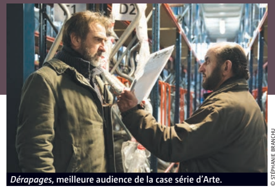
Dérapiages, meilleure audience de la case série d'Arte.

Les records sur le petit écran continuent de tomber. Après Harry Potter à l'école des sorciers , Shrek le troisième et Candice Renoir saison 8, la semaine précédente, le tableau de chasse hebdomadaire consacre les longs métrages Bullitt et La cuisine au beurre , Tandem saison 3 (cf. clignotants ), et Dérapiages , la nouvelle série française d'Arte. Jeudi 23 avril, la fiction réalisée par Ziad Doueiri, écrite par Pierre Lemaître, d'après son roman Cadres noirs (éd. Calmann-Lévy) et interprétée par Éric Cantona, aux côtés d'Alex Lutz, Suzanne Clément, Alice de Lencquesaing ou Gustave Kervern, a rassemblé 2,2 millions de téléspectateurs (8,1% de PDA), à 21 h. Le deuxième épisode de la soirée (mais le second du prime-time) réussit l'exploit de progresser, pour atteindre 2,23 millions (9,2%). À 22h40, le troisième des six opus de la série attire encore 1,85 million d'amateurs (11,9%). En moyenne, sur la tranche du prime-time, Dérapiages , polar social sur fond de cynisme ultralibéral, fédère donc 2,22 millions d'amateurs (8,7%), au coude-à-coude avec