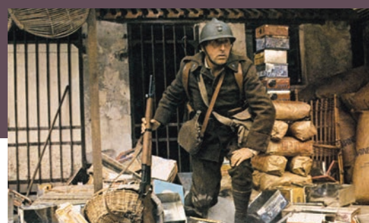
Mais où est donc passée la 7 e Compagnie? mobilise encore 6,7 millions de téléspectateurs après une énième diffusion sur TF1.

Les Anglo-saxons appellent cela de la "comfort food". Ce qui pourrait se traduire par "de la nourriture pour se sentir mieux". Le contexte anxiogène et les questions que la population se pose mobilisent toujours les téléspectateurs vers les JT et les chaînes infos qui battent des records d'audience. Et la parole politique est plus que jamais attendue. Ainsi, l'allocution du président Emmanuel Macron a été suivie lundi 13 avril par 36,7 millions de téléspectateurs sur les 11 chaînes qui la diffusaient. Un record absolu ! Et avec un million de spectateurs de plus que le 16 mars ! L'allocution a récolté une part d'audience globale de 94,4%, attirant donc la quasi-totalité des Français qui regardaient la télévision entre 20h02 et 20h30. En dehors de ses rendez-vous fédérateurs, le public se mobilise sur des marques et des divertissements connus et rassurants. Ainsi, TF1 signe deux belles performances avec deux programmes illustrant parfaitement ce créneau. Vendredi 10 avril, le 7 e numéro de Koh-Lanta : l'île des héros attire