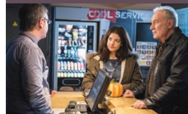
Vivre sans eux.

MONGEVILLE Samedi 11 avril, c'est France 3 qui domine confortablement les audiences grâce à un épisode inédit de la série, baptisé Le mâle des montagnes , réalisé par Edwin Baily. Cette collection de polars a embarqué 5,86 millions de téléspectateurs, soit 22,6 % de PDA selon Médiamétrie. Le record historique du programme dont l'arrêt a pourtant été annoncé ! Quatre épisodes de Mongeville restent à diffuser. Deux ont déjà été tournés et les deux derniers ont été interrompu en raison de l'épidémie de coronavirus.