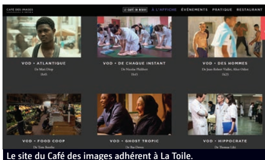
Le site du Café des images adhère à La Toile.

Une démarche dans laquelle s'est également inscrite La Baleine de Marseille. Le monoécran art et essai a en effet lancé, le 25 mars, une sélection hebdomadaire de films en V&D, La Baleine de chez soi, intégrée au site web de la salle. Les œuvres choisies sont accessibles sur la plateforme V&D de Shellac, en location au tarif de 4 €, les recettes étant réparties entre le distributeur, la plateforme (Shellac donc) et La Baleine. "L'objectif est de maintenir un lien avec nos