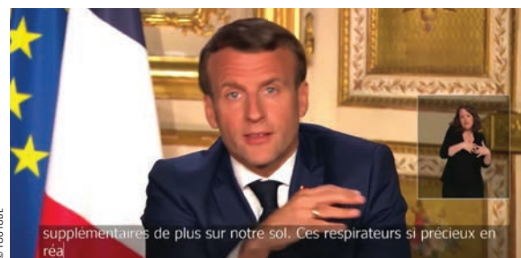
Allocution d'Emmanuel Macron du lundi 13 avril.

Fermeture des cinémas prorogée, interdiction des "grands festivals" avant la mi-juillet, "plan spécifique" pour la culture... L'allocution d'Emmanuel Macron a été l'occasion de plusieurs annonces pour la filière. Tour d'horizon. ■ K.B., V.L.L et S.D.