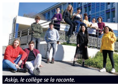
Askip, le collège se la raconte.

"Nous avons essayé d'offrir un divertissement intelligent, en étant moderne, dynamique et le plus drôle possible. Et qui puisse aussi être regardé par des plus vieux. Je suis fan de séries comme The Office ou Modern Family , qui sont des sortes de "mockumentaires", un genre qui se fait assez peu en France. En jouant sur ces codes-là, cela donne une vraie saveur et la possibilité de toucher la cible