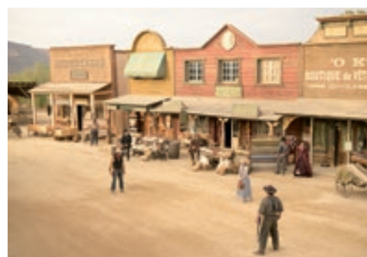
La série Lucky Luke .

À partir de là, les projets peuvent se décliner en séries, films, spectacles, expositions immersives ou expériences live. Ainsi Un Pour Tous Productions produit l'exposition événement célébrant les 80 ans de Lucky Luke , présentée à Paris à partir de septembre 2026, en collaboration avec Médiatoon Licensing, Dargaud et Dupuis. Elle s'inscrit dans un programme d'expositions nationales dédiées à cet anniversaire majeur, et sera également présentée à Amiens, Saint-Malo et au Havre. Enfin, en octobre 2027, le western musical sera monté dans un grand théâtre parisien. Une façon pour la structure de montrer sa capacité à faire de l'audiovisuel, de l'exposition et du spectacle musical. Un Pour Tous développe aujourd'hui plusieurs projets de fiction premium, dont l'adaptation en prises de vues réelles de Michel Vaillant , en coproduc-