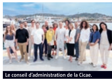
Le conseil d'administration de la Cicae.

naux et internationaux permettant aux cinémas indépendants d'accomplir leur mission culturelle essentielle à travers le monde". La confédération a ensuite insisté sur "l'importance de préserver la pluralité et la diversité des acteurs du marché dans le secteur audiovisuel et de mettre en place des mesures visant à stopper et inverser la concentration continue du pouvoir de mar-