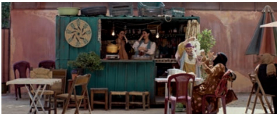
☺ The Station de Sara Ishaq, en lice à la Semaine de la critique.